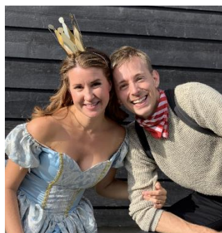
Rebusløp og teater for barna 2019